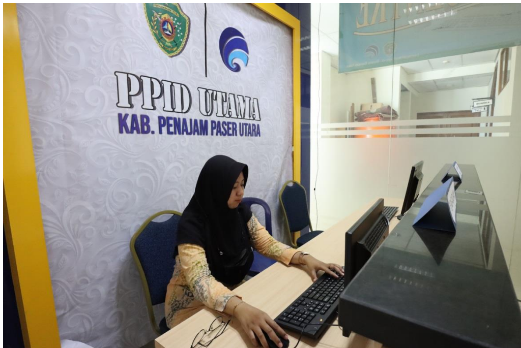
Ruang Layanan Informasi